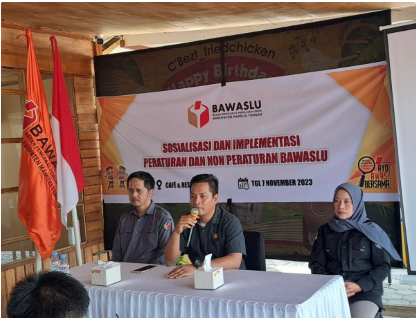
Mamuju Tengah – Badan Pengawas Pemilihan Umum (Bawaslu) Kabupaten